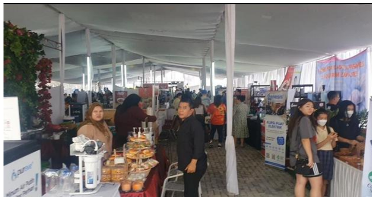
Gambar 2. Stand Bazar

Spirit entrepreneurship yang dibangun dalam festival ini berakar pada nilai kekeluargaan, solidaritas, dan kerja sama. Setiap stand bazar tidak hanya menawarkan produk, tetapi juga membangun relasi yang lebih luas dengan pengunjung, menjadikan transaksi sebagai sarana mempererat jejaring sosial. Dengan pendekatan ini, gereja menunjukkan bahwa pelayanan kepada masyarakat tidak hanya terbatas pada bidang spiritual, tetapi juga mencakup pengembangan kapasitas ekonomi umat secara holistik. (Lumimpah, 2022) Dalam konteks ini, gereja menjadi agen transformasi sosial yang mendukung pertumbuhan ekonomi lokal dengan pendekatan yang ramah dan berbasis nilai-nilai Kristen.