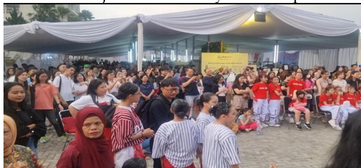
Gambar 3. Situasi Lomba Modern Dance umum

Melalui pendekatan multi-dimensi ini, ekonomi, edukasi, seni, dan olahraga. Great Festival 2024 telah membuktikan diri sebagai platform strategis untuk membangun kehidupan komunitas urban yang holistik. Gereja tampil sebagai ruang yang adaptif, responsif terhadap kebutuhan zaman, serta tetap setia membawa nilai-nilai Injil ke dalam denyut kehidupan sehari-hari.