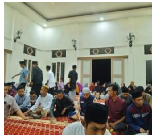
Gambar 3. focus group discussion (FGD) dengan Jamaah