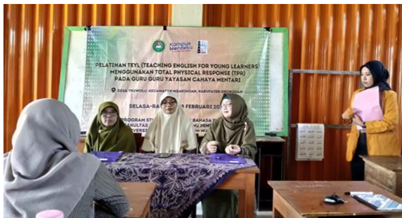
Gambar 2. Pembukaan Kegiatan Pengabdian kepada Masyarakat

Sebelum pelatihan dimulai, terlebih dulu diadakan pretest untuk mengetahui pengetahuan awal dari para peserta. Begitu pun setelah pelatihan diadakan post test untuk mengetahui apakah peserta sudah menyerap materi yang sudah diberikan. Pertanyaan yang menjadi materi pre test dan post test meliputi berikut ini.