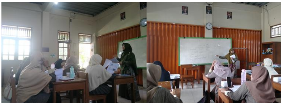
Gambar 3. Pemberian materi TEYL dan Pemberian materi TPR

Sementara itu, kegiatan hari kedua adalah pendampingan ke kelas. Tim abmas ikut masuk ke kelas mendampingi para guru di dalam mempraktekkan TPR di dalam interaksi mereka dengan anak-anak dalam kegiatan harian.