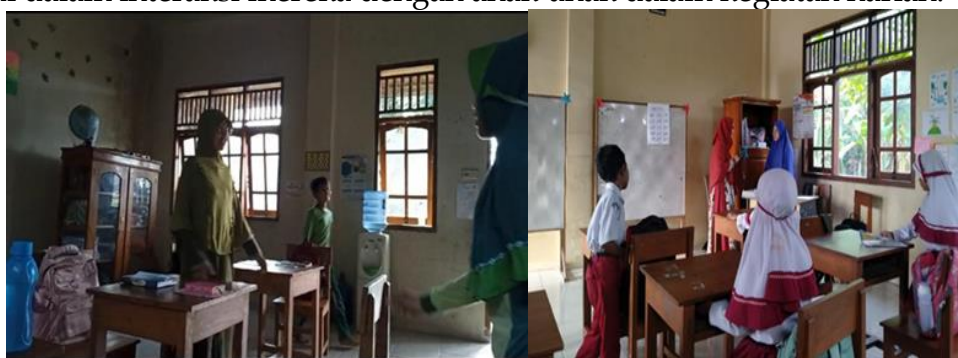
Gambar 4. Pendampingan di kelas

Sementara itu, kegiatan hari kedua adalah pendampingan ke kelas. Tim abmas ikut masuk ke kelas mendampingi para guru di dalam mempraktekkan TPR di dalam interaksi mereka dengan anak-anak dalam kegiatan harian.