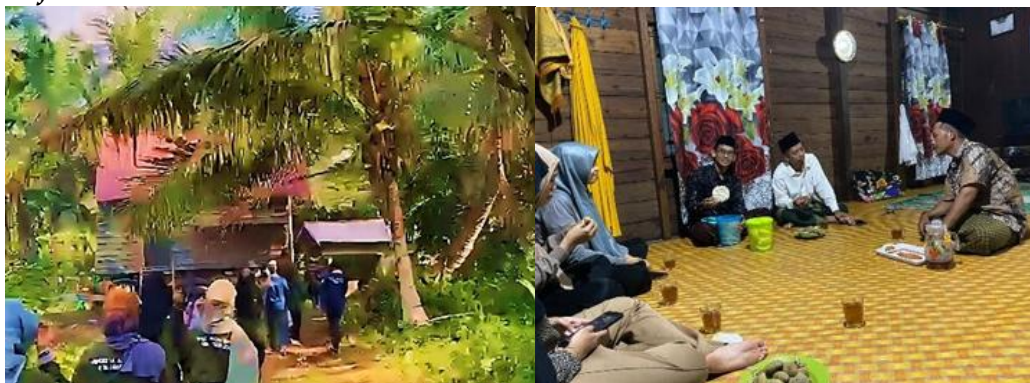
Gambar 2. Dokumentasi Observasi

Hasil penelitian menunjukkan bahwa Desa Lintas Utara memiliki potensi besar di sektor pertanian, perkebunan bahwa ada potensi desa seperti VCO (virgin coconut oil) yang memiliki nilai jual tinggi dan dari limbah vco itu sendiri dapat dimanfaatkan kembali untuk diolah menjadi produk turunannya yaitu Stik Ampas Kelapa namun dikarenakan keterbatasan infrastruktur, seperti jalan yang kurang memadai dan minimnya akses transportasi, minim pemasaran secara digital menjadi faktor utama yang menghambat perkembangan ekonomi di Desa Lintas Utara., serta rendahnya keterampilan