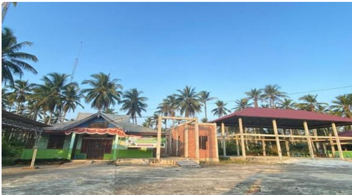
Gambar 1. Kantor Desa Lintas Utara

Dengan 517 keluarga, Desa Lintas Utara berpenduduk 1.833 jiwa, terdiri dari 946 laki-laki dan 887 perempuan. Mayoritas penduduk etnis Jawa dan Bugis di Desa Lintas Utara umumnya berprofesi sebagai petani. Selain potensi di bidang perkebunan kelapa sawit dan kelapa lokal, lingkungan desa masih memiliki lahan perkebunan yang luas, yang berarti penduduk Desa Lintas Utara memiliki sumber ekonomi yang sangat menjanjikan di bidang pertanian dan perkebunan, terutama di sektor pertanian dan perkebunan.