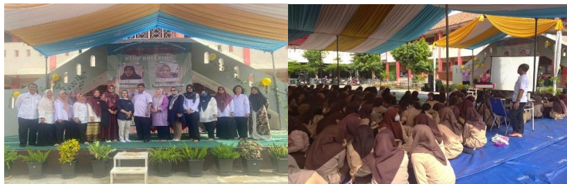
Gambar 3. Pelaksanaan Kegiatan Sosialisasi “Stop Bullying, Bahaya Bullying bagi Perkembangan Jiwa”