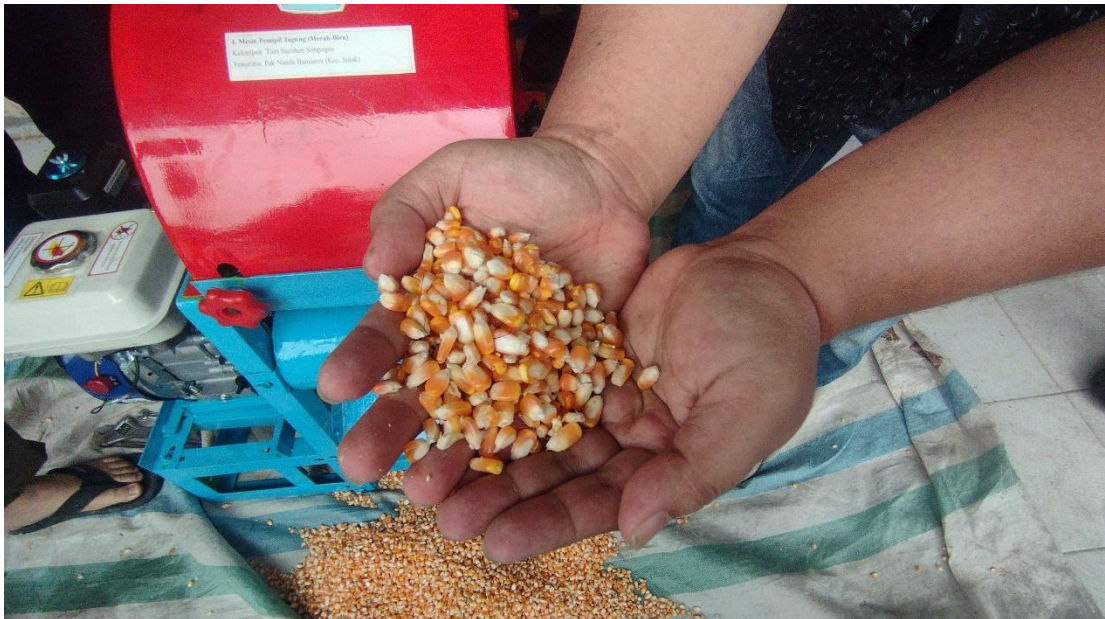
Gambar 6. Evaluasi Hasil Pemipilan Jagung