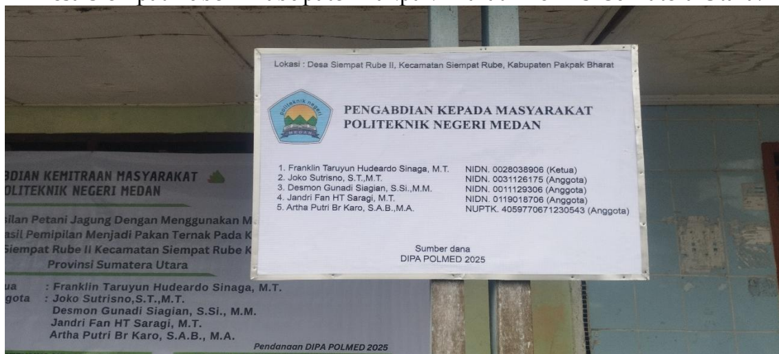
Gambar 3. Gambar Plang PKM