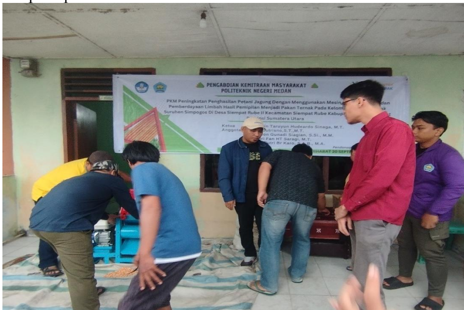
Gambar 4. Gambar pengoperasian mesin pemipil Jagung oleh Tim PKM dibantu Mitra PKM