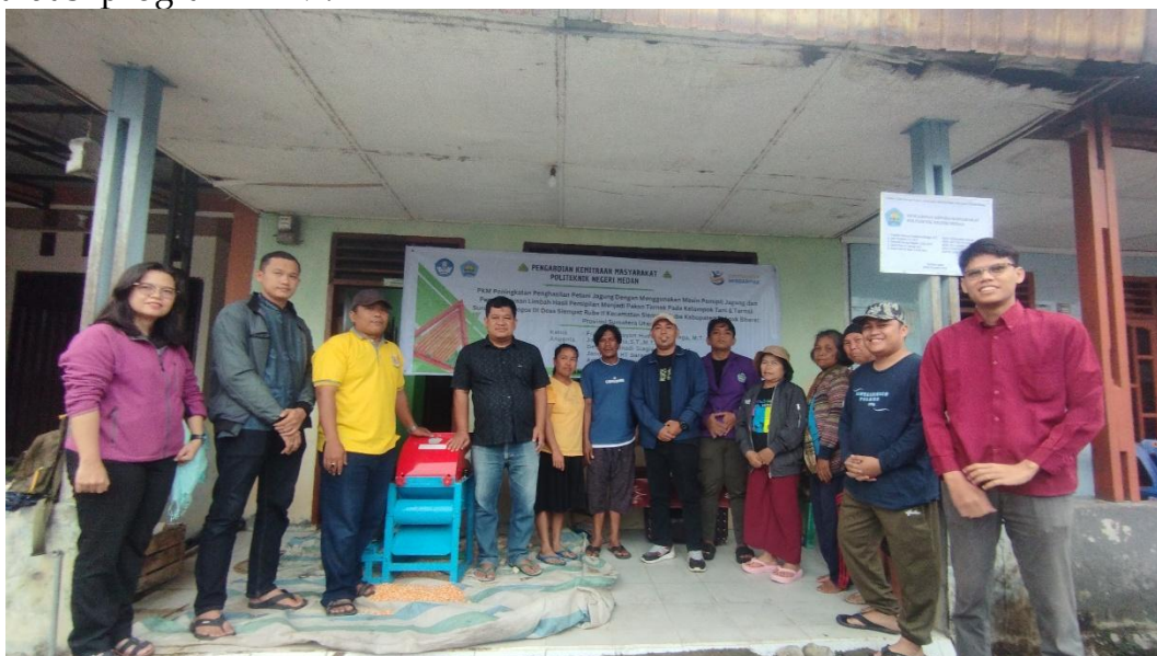
Gambar 7. Foto Bersama Tim PKM dan Mitra

Metode penelitian tindakan partisipasi (PKM) digunakan untuk melaksanakan PKM. Metode ini menyadarkan masyarakat tentang potensi dan masalah yang ada melalui partisipasi atau keterlibatan mereka dalam kegiatan perubahan. Dalam pelaksanaan program PKM Peningkatan Penghasilan Petani Jagung dengan Menggunakan Mesin Pemipil Jagung dan Pemberdayaan Limbah Hasil Pemipilan Menjadi Pakan Ternak Kelompok Tani Suruhen Simpogos di Desa Siempat Rube II Kabupaten Pakpak Bharat Provinsi Sumatera Utara dilaksanakan melalui beberapa tahapan yakni tahap indentifikasi masalah melalui observasi lapangan kemudian dilanjutkan dengan tahapan perencanaan program, dilanjut dengan pelaksanaan program serta yang terakhir adalah tahap evaluasi program PKM.