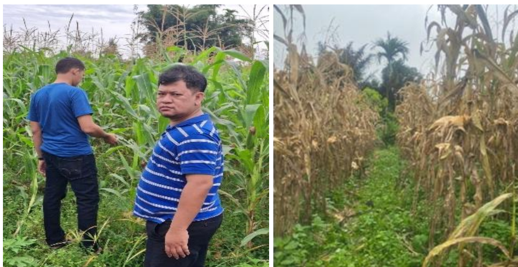
Gambar 1. Ladang Jagung Milik Ketua di Desa Siempat Rube II

Mesin pemipil jagung ini bekerja dengan motor listrik yang berfungsi sebagai penggerak. Adanya mesin ini membuat proses pemipilan jagung lebih efisien dan efektif dibandingkan dengan proses manual sebelumnya. Kelompok Tani dan Ternak Suruhen Simpogos, yang berlokasi di Desa Siempat Rube II, Kecamatan Siempat Rube, Kabupaten Pakpak Bharat, telah berkontribusi pada proposal pengabdian ini.