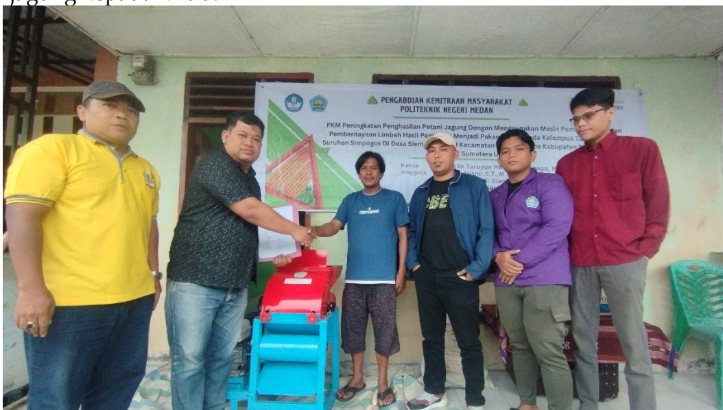
Gambar 5. Penyerahan Mesin Pemipil Jagung Oleh Ketua Tim PKM kepada Mitra