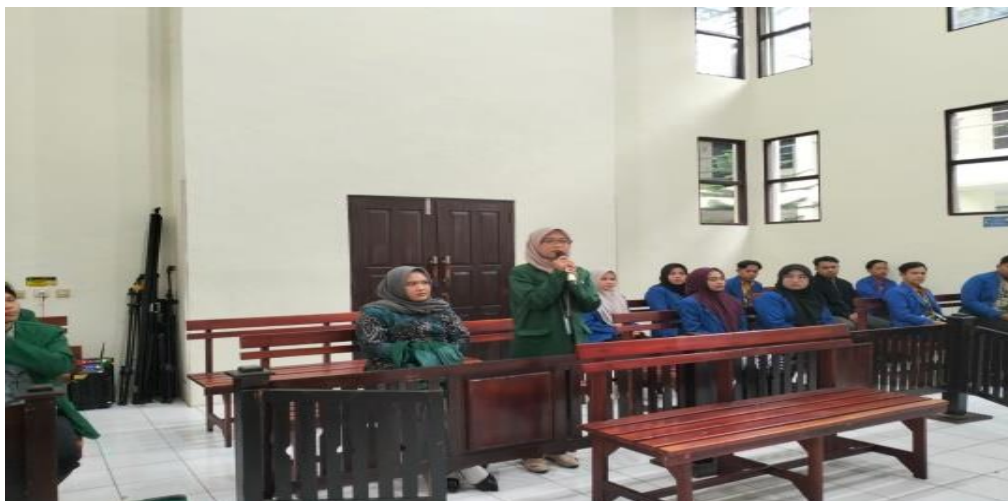
Gambar 7. Saat Pembelajaran

Pengadilan Negeri Banjarbaru sekaligus Pamong/Pembimbing selama melaksanakan PKH.