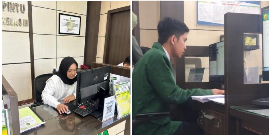
Gambar 5. Menjaga Meja PTSP

Dalam pendahuluan telah dikatakan bahwa selama melaksanakan PKH, menjaga meja PTSP merupakan salah satu tugas mahasiswa magang. PTSP merupakan garda terdepan dalam pelayanan di Pengadilan Negeri Banjarbaru. Mahasiswa magang seringkali ditempatkan di meja PTSP untuk membantu petugas ataupun untuk menggantikan sementara petugas meja PTSP. Dari ditematkannya mahasiswa di meja PTSP ini dapat memberikan pelajaran penting mengenai etika dalam melakukan pelayanan publik dan komunikasi yang pantas.