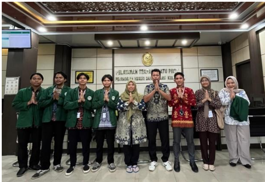
Gambar 6. Foto Bersama Petugas/Pegawai Meja PTSP