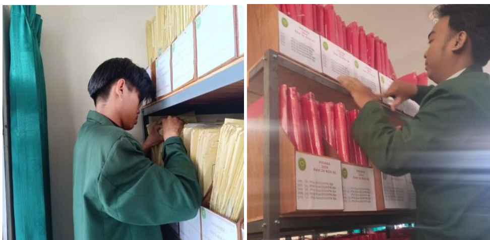
Gambar 4. Pengecekan Dokumen di Ruang Arsip