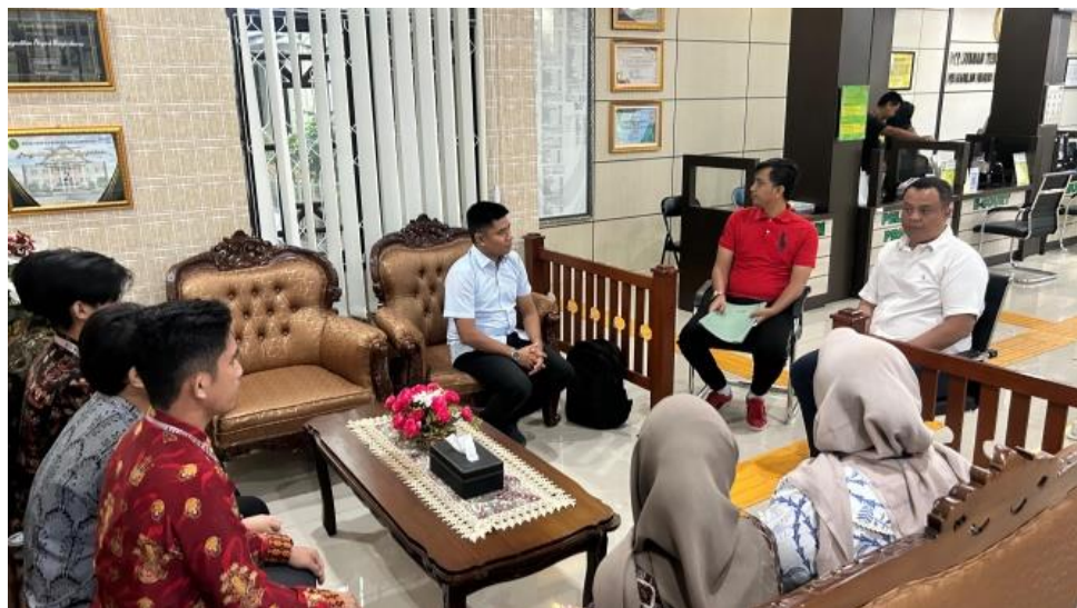
Gambar 2. Penjemputan Mahasiswa Magang

Sedangkan dalam penelitian ini, penulis menggunakan metode deskriptif kualitatif. Deskriptif yaitu suatu rumusan masalah yang menjadi panduan untuk