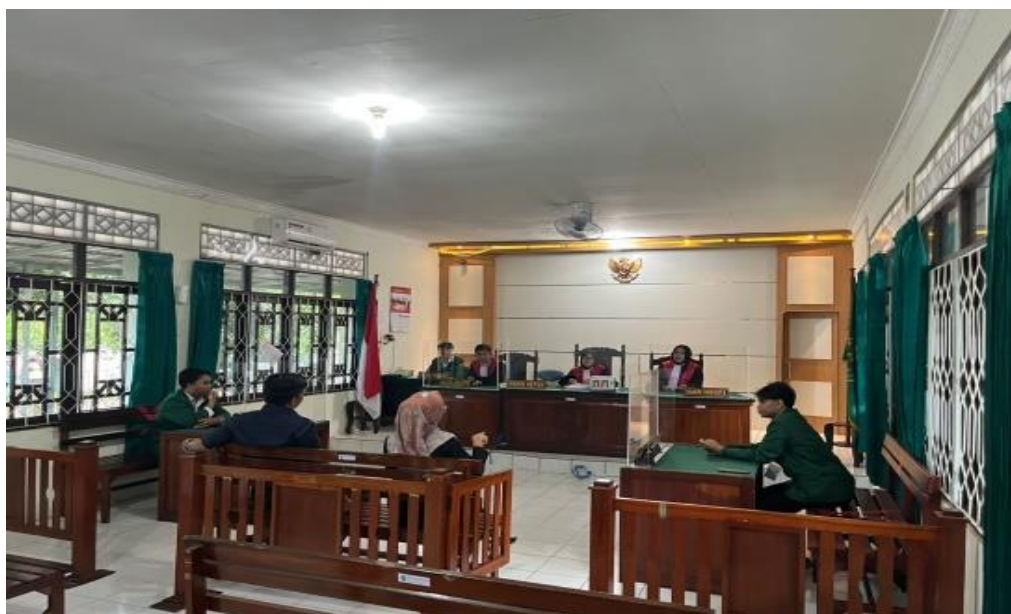
Gambar 8. Simulasi Moot-Court di Ruang Sidang Tirta