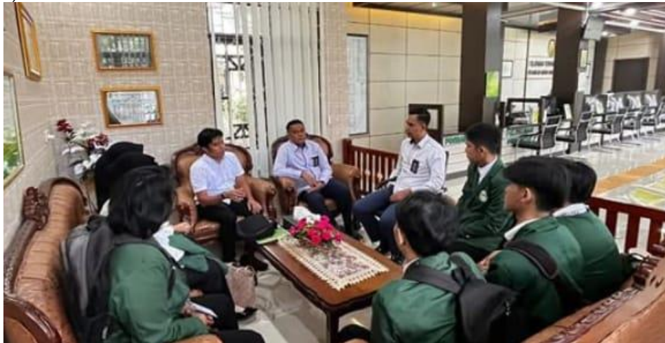
Gambar 1. Pengantaran Mahasiswa Magang

Pelaksanaan pengabdian atau yang disebut sebagai Praktek Kemahiran Hukum bertempat di Pengadilan Negeri Banjar Baru, Kota Banjar Baru, Kalimantan Selatan. Pelaksanaan PKH ini dimulai pada hari Senin, 6 Januari 2025 hingga Jumat, 7 Februari 2025, 25 hari kerja. Terdapat beberapa langkah dalam metode yang digunakan, yaitu mulai dari rancangan awal di mana kelompok PKH dibentuk oleh Ketua Program Studi serta Ketua Pelaksana berdasarkan minat Mahasiswa terhadap instansi yang diinginkan. Kemudian diadakan pertemuan sebagai bentuk persiapan melaksanakan PKH. Lalu tahap pelaksanaan yang diawali dengan pengantaran mahasiswa magang oleh Dosen Pembimbing PKH pada Senin, 6 Januari 2025. Dan diakhiri, dengan penjemputan kembali mahasiswa magang oleh Dosen Pembimbing PKH pada Jumat, 7 Februari 2025. Pelaksanaan PKH ini berlangsung selama 25 hari kerja dengan jadwal hari Senin-Jumat mulai pukul 08.00 WITA-16.30 WITA/17.00 WITA (Jumat).