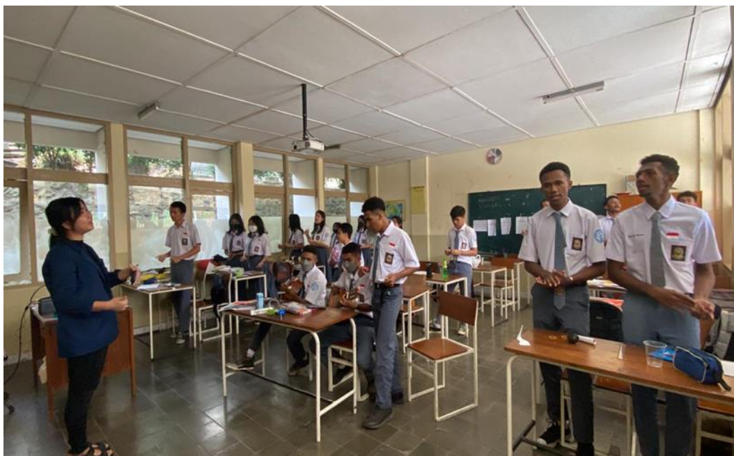
Gambar 1. Kegiatan Praise dan Worship

Setelah itu di lanjutkan dengan penyampaian materi firman Tuhan dengan menggunakan metode lokakarya. Dalam penyampaian materi peneliti menekankan pentingnya untuk menentukan tujuan apa yang akan peserta didik setelah lulus dari SMA harapan dan cita-cita mereka apa. Sebelum adanya diskusi dan sharing yang akan dibagikan dalam tiga kelompok. Peneliti terlebih dahulu menyampaikan materi yang akan di bahas yaitu mengenai “Masa depan ada dalam jaminan Tuhan, Yeremia 29:11-13”, materi yang di sampaikan menekankan tiga yaitu, pertama Tuhan mengetahui segala rencana apa yang akan kita tentukan sekarang. Kedua rancangan Tuhan bukan rancangan kecelakaan karena, Yesus Kristus selalu memiliki rancangan yang indah untuk masa depan kita yang harapan. Ketiga rancangan Tuhan adalah rancangan damai sejahtera, karena setiap apa yang kita rencanakan dalam Tuhan pasti akan memimpin kita. Materi ini sangat penting bagi peserta didik SMA kelas XII karena di lihat mereka sebentar lagi akan lulus dari SMA.