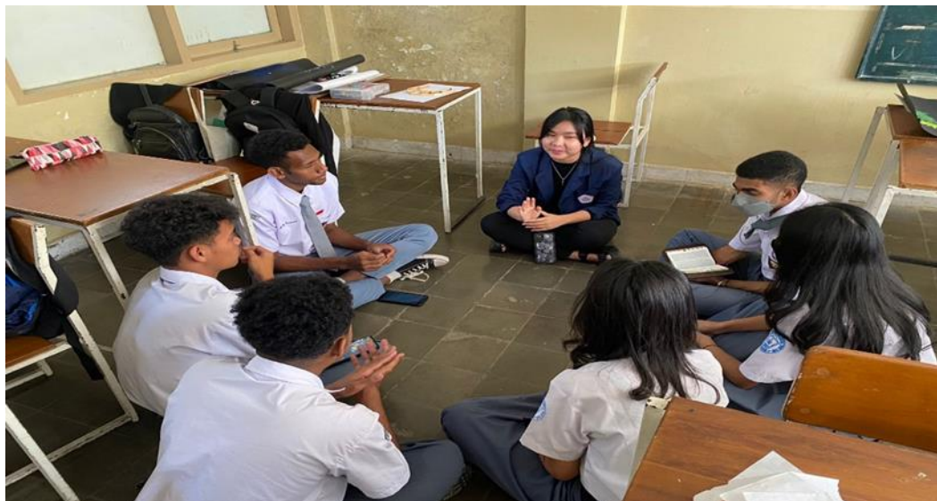
Gambar 3. Kegiatan Sharring dalam bentuk kelompok

Setelah melakukan kegiatan dalam penyampaian firman Tuhan dan sharring yang di lakukan di SMA Kristen Hidup Baru Bandung peneliti mengajak setiap dari kelompok peserta didik untuk saling bergandengan tangan dan berdoa bersama, adapun yang menjadi topik doanya adalah harapan yang sudah di sampaikan oleh peserta didik, yang sudah di sampaikan dalam sharring kelompok. Sebelum berdoa peneliti terlebih dahulu mengajak peserta didik untuk sungguh-sungguh berdoa dan berserah kepada Tuhan. Setelah selesai melakukan kegiatan seminar disekolah SMA Kristen Hidup Baru Bandung, peneliti memberikan peserta didik kepada guru Pendidikan Agama Kristen di sekolah tersebut untuk melanjutkan dalam sharring atau mengadakan komsej kepada peserta didik.