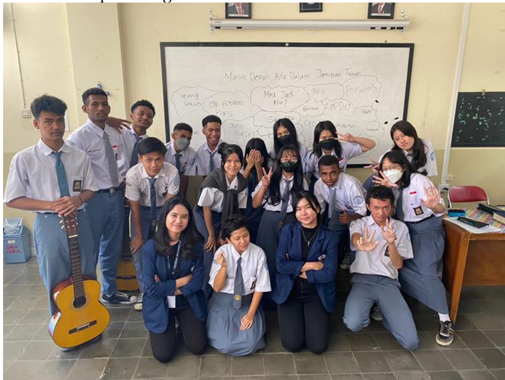
Gambar 5. Kegiatan foto bersama di akhir kegiatan

Berdasarkan penjelasan di atas, dapat disimpulkan masa depan merupakan faktor penting dan relevan dalam menghadapi dunia, peserta didik SMA Kristen Hidup Baru, oleh karena itu, mahasiswa tingkat akhir yang merasa takut dan khawatir untuk menghadapi dunia karena harus merencanakan masa depannya sedemikian rupa sehingga mampu mengoptimalkan kemampuannya dalam bersaing di dunia kerja. Siswa yang mampu memprediksi tujuan karirnya berdasarkan kemampuannya mempunyai tingkat kematangan profesional yang tinggi. Kemampuan berorientasi pada pekerjaan akan mendorong individu untuk mempersiapkan rencana karir yang lebih matang sehingga mengurangi perasaan cemas individu. Kegiatan seminar yang di lakukan oleh peneliti adalah membangun semangat peserta didik dalam memperjuangkan masa depan mereka dan jangan menggandalkan kekuatan sendiri tetapi mengandalkan Tuhan dalam setiap rancangan mereka.