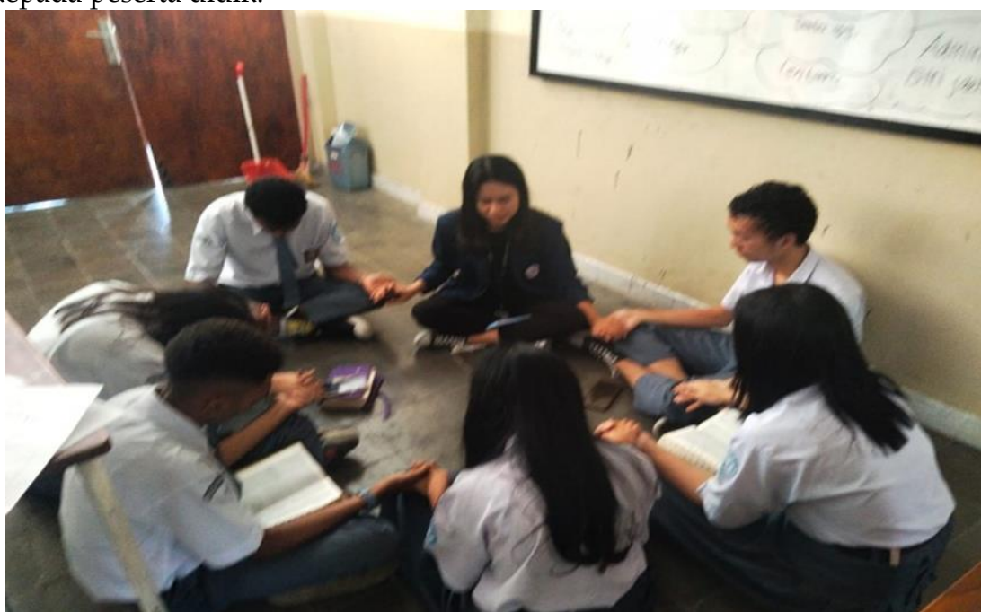
Gambar 4. Kegiatan Berdoa bersama-sama

Setelah melakukan kegiatan dalam penyampaian firman Tuhan dan sharring yang di lakukan di SMA Kristen Hidup Baru Bandung peneliti mengajak setiap dari kelompok peserta didik untuk saling bergandengan tangan dan berdoa bersama, adapun yang menjadi topik doanya adalah harapan yang sudah di sampaikan oleh peserta didik, yang sudah di sampaikan dalam sharring kelompok. Sebelum berdoa peneliti terlebih dahulu mengajak peserta didik untuk sungguh-sungguh berdoa dan berserah kepada Tuhan. Setelah selesai melakukan kegiatan seminar disekolah SMA Kristen Hidup Baru Bandung, peneliti memberikan peserta didik kepada guru Pendidikan Agama Kristen di sekolah tersebut untuk melanjutkan dalam sharring atau mengadakan komsej kepada peserta didik.